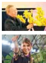
假屋崎 省吾氏 志穂美 悦子氏

華道家・假屋崎省吾氏と女優・志穂美悦子氏が今回も世界らん展に登場。大胆な展示と豪華なステージを展開します。